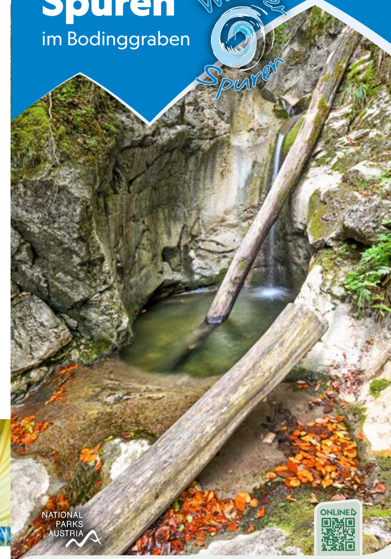
NATIONAL PARKS AUSTRIA