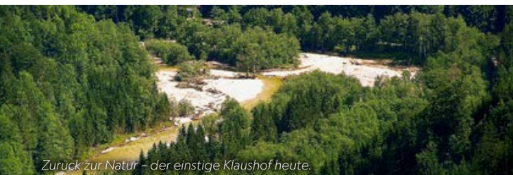
Zurück zur Natur – der einstige Klaushof heute.

Karoline Kopf +43 680 1190790 oder +43 680 2110218 johann.kopf@gmx.at