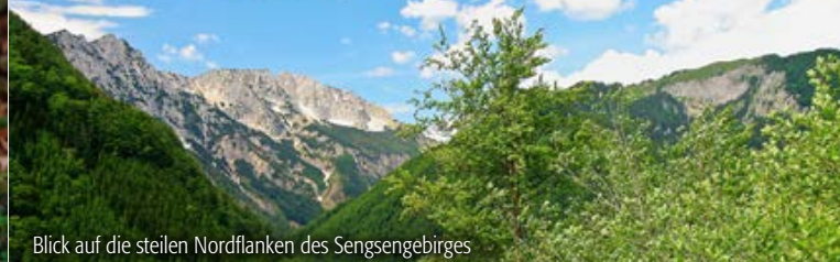
Blick auf die steilen Nordflanken des Sengsengebirges