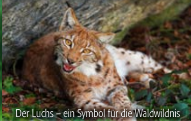
Der Luchs – ein Symbol für die Waldwildnis