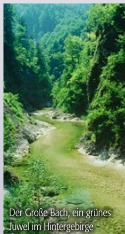
Der Große Bach, ein grünes Juwel im Hintergebirge

Republik Österreich ... 88 % Privatbesitz ..... 11 % Gemeindebesitz ..... 1 %