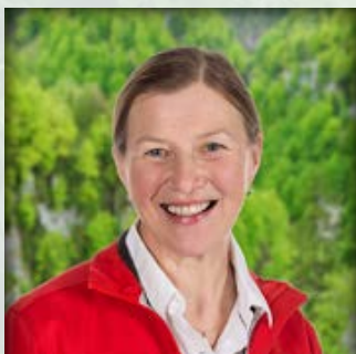
Erni Kirchweger FamilienCamps, WildnisCamp für Kids und Jugendliche