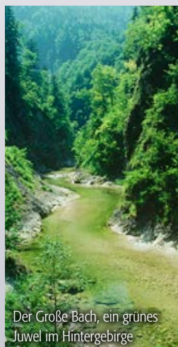
Der Große Bach, ein grünes Juwel im Hintergebirge