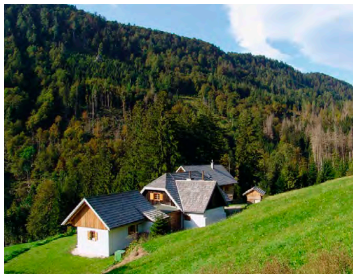
Das Nationalpark WildnisCamp liegt auf einer sonnigen Waldlichtung.

Auf einer sonnigen Lichtung mitten im Waldmeer des Nationalpark Kalkalpen liegt das Nationalpark WildnisCamp. Die komfortable Oase in der Wildnis ist der ideale Stützpunkt für unsere WildnisCamp Programme mit Nationalpark Rangern und WildnispädagogInnen. Genießen Sie ein paar Tage Auszeit in der Natur für gemeinsame Wanderungen auf einsamen Pfaden, Essen kochen am Lagerfeuer und stimmungsvolle Abende. Entdecken Sie wie man Feuer macht, Tierspuren richtig erkennt und welche Pflanzen essbar sind. Das Camp ist vom Parkplatz am Hengstpaß nur zu Fuß erreichbar, das Handy hat dort Sendepause.