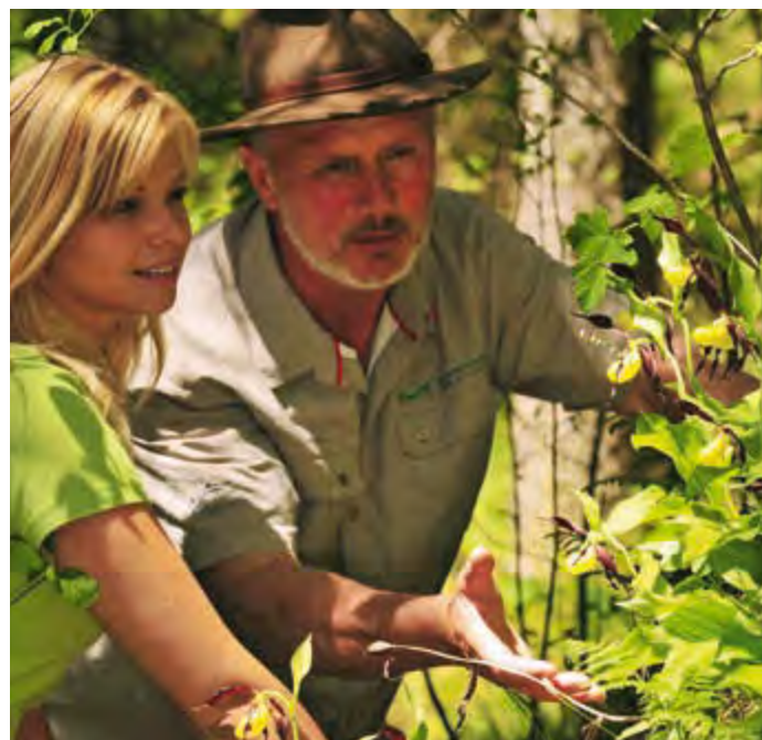
Zu Besuch beim „Frauenschuß“, der auffälligsten der heimischen Orchideenarten.