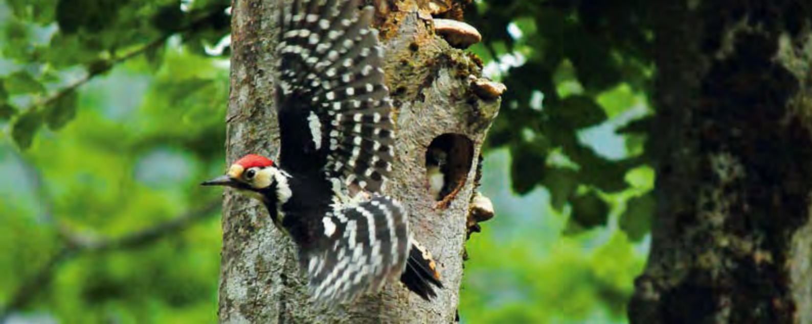
Männchen des Weißrückenspechts vor der Bruthöhle.