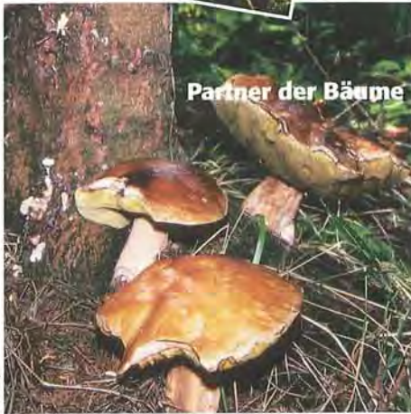
Partner der Bäume