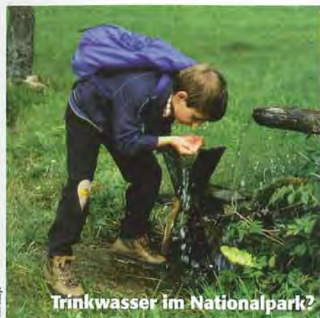
Trinkwasser im Nationalpark?