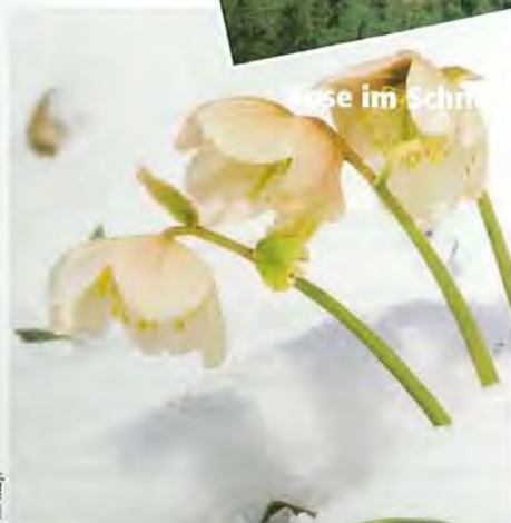
Schneeflocke im Schnee