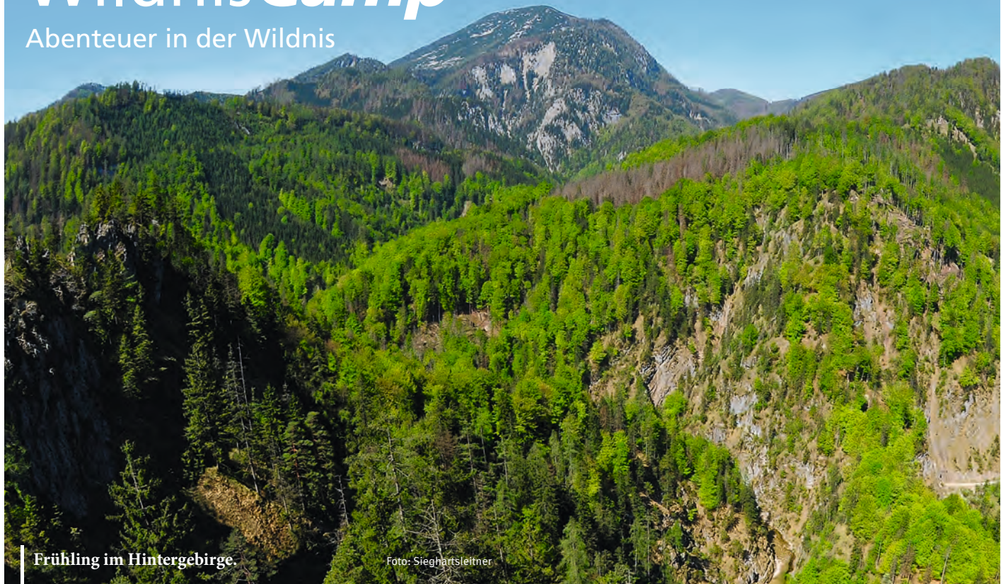
Frühling im Hintergebirge.