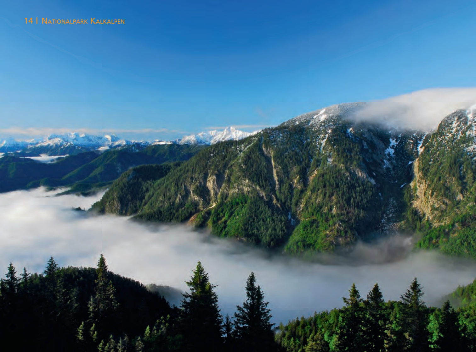
Blick vom Alpstein über den Jörglgraben Richtung Nationalpark Gesäuse