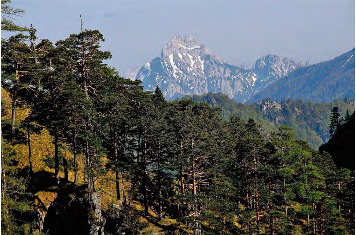
Kalkalpen und Gesäuse – ökologischer Verbund