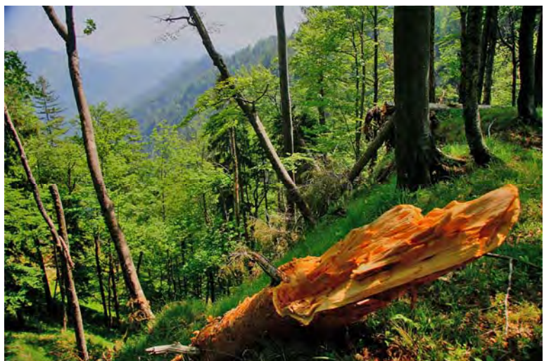
Waldwildnis mit vielfältiger, ökologischer Wirkung

Wildnis ist ein großes zusammenhängendes Gebiet, in welchem die Natur sich selbst überlassen ist. Menschliche Eingriffe sind zur Erreichung der Nationalpark Ziele möglich.