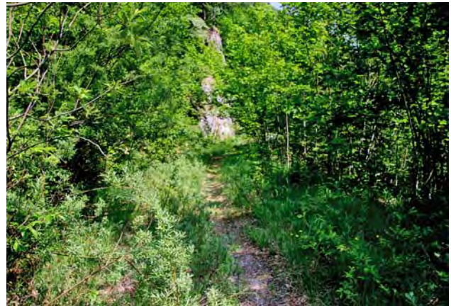
Natürliche Prozesse auf ehemaligen Forststraßen