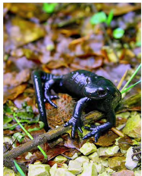
Ruhe und Gelassenheit