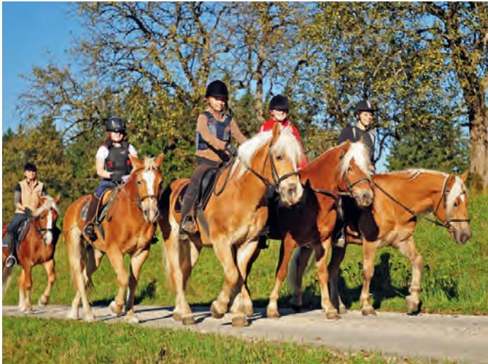
Aufregend und unvergesslich bleiben die ersten Ausritte in die Weyrer Kulturlandschaft.