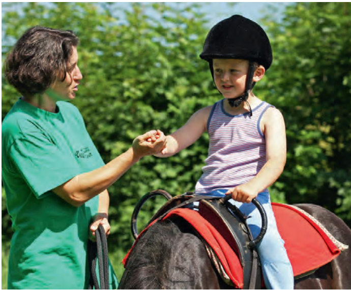
Mit und auf dem Pferd werden Kinder angeregt, Bewegungserfahrungen zu sammeln.

Dass Pferde nicht nur als Sport- und Freizeitpartner zum Einsatz kommen, weiß man im Zentrum für ganzheitliche Reitpädagogik Voglhub in St. Ulrich. Neben dem nach Sabine Dell'mour gestalteten Reitunterricht wird von Familie Fachberger-Platzer auch therapeutisches Reiten für Kinder oder Erwachsene mit körperlichen oder geistigen Beeinträchtigungen und besonderen Bedürfnissen angeboten. Pferde vermögen oft dort zu helfen, wo der Mensch nichts mehr bewegen kann, da sie auf das Verhalten des Reiters und nicht auf seine Handicaps reagieren.